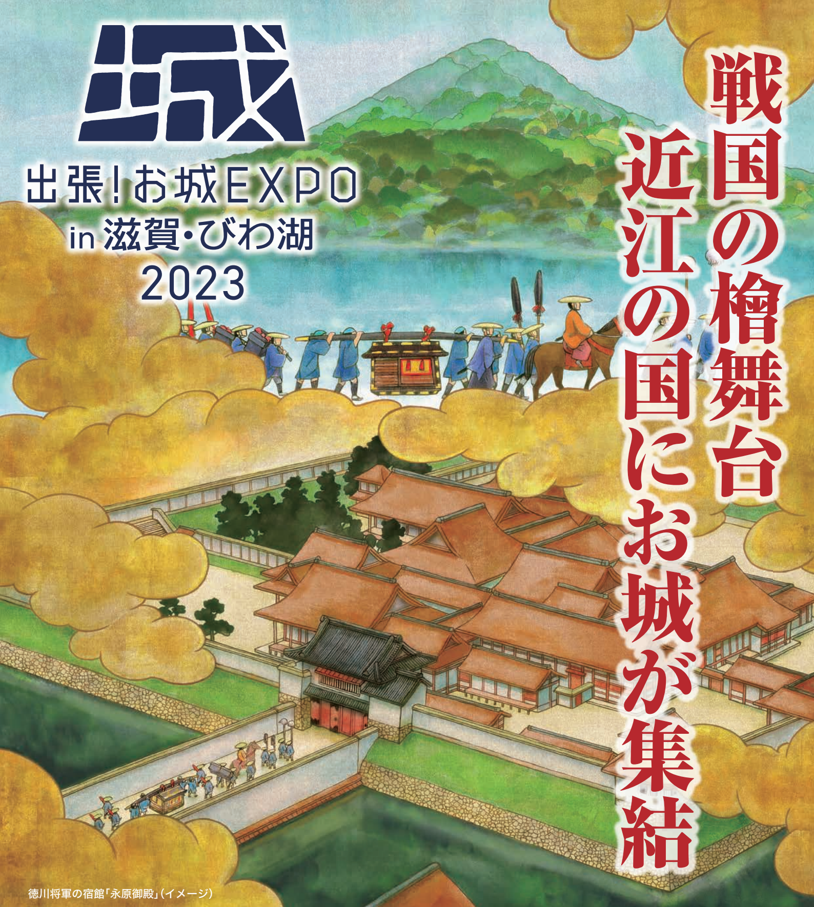
徳川将軍の宿館「永原御殿」(イメージ)