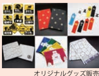
オリジナルグッズ販売

日本最大級! 30万人が熱狂するスマートフォン向け城郭アプリ「ニッポン城めぐり」のレア異名が当たるガラポン抽選会を開催します。